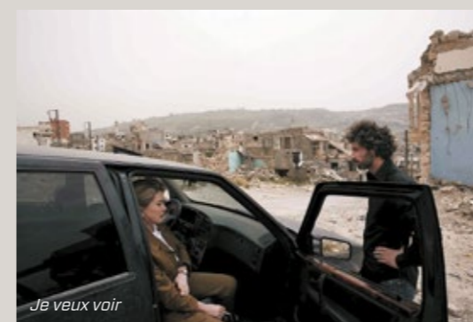
Je veux voir