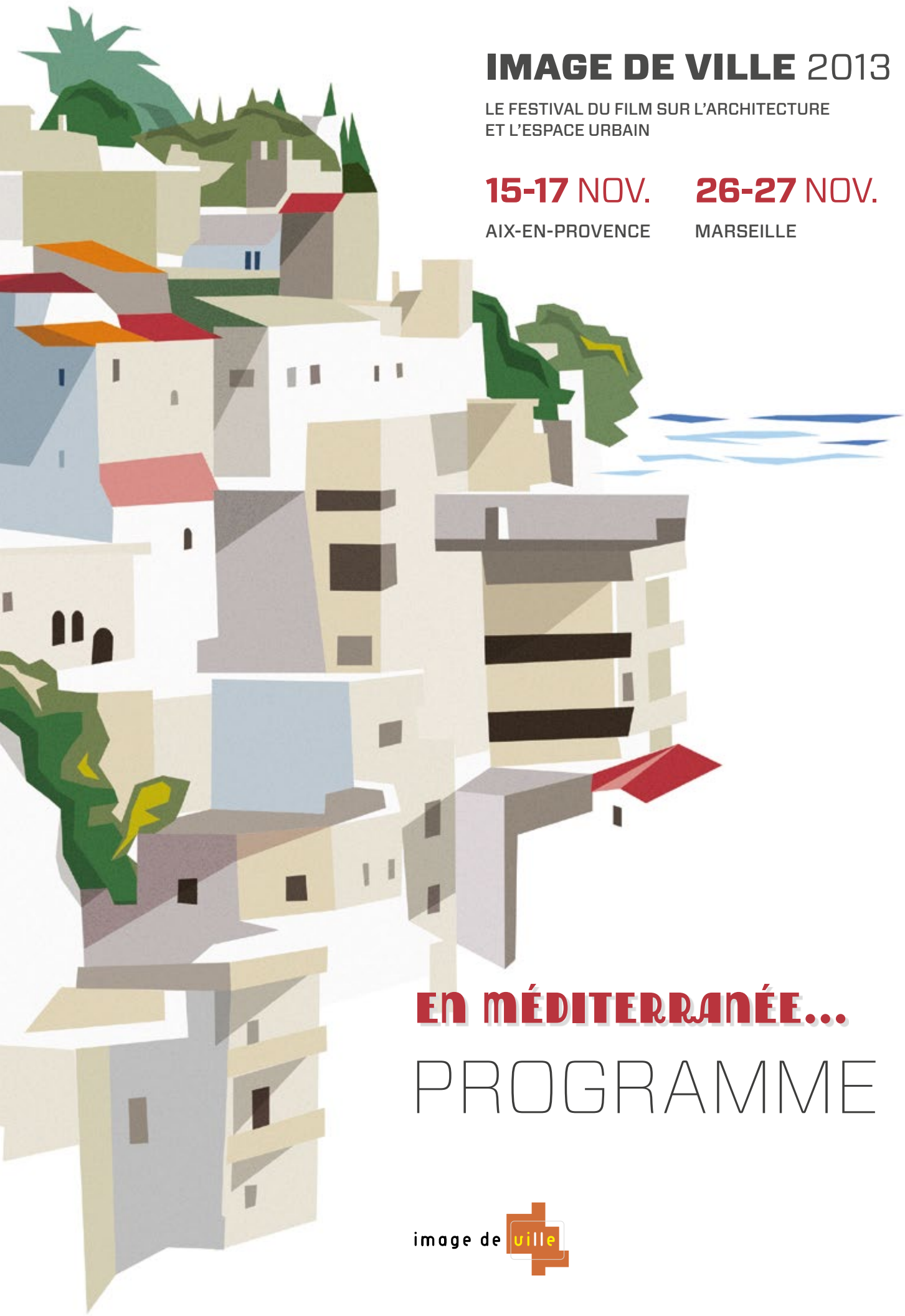
IMAGE DE VILLE 2013

LE FESTIVAL DU FILM SUR L'ARCHITECTURE ET L'ESPACE URBAIN